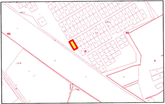
Ситуационный план М 1:14000